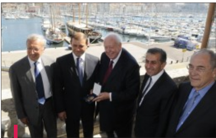
Jean-Claude Gaudin, maire de Marseille (au centre), a accueilli Taron Margaryan, maire d'Erevan (à sa droite)

Hier, Jean-Claude Gaudin recevait Taron Margaryan, maire de la ville d'Erevan (Arménie). Depuis 20 ans, la Ville entretient des coopérations gouvernementales, sociales et économiques dans un climat amical avec Erevan. Lors de cette rencontre, M. Gaudin a remis la médaille de citoyen d'honneur de la ville de Marseille au maire