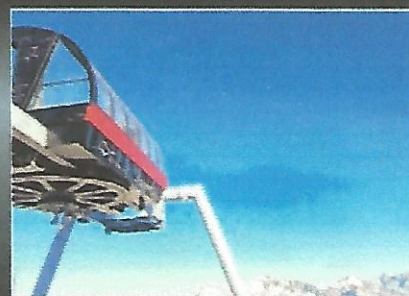
Le nouveau télésiège du domaine est une machine d'occasion qui à moindre coût va venir remplacer deux remontées obsolètes.