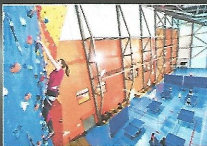
Depuis deux ans le Dévoluy dispose d'un centre sportif. Quand la météo n'est pas au rendez-vous il y a toujours quelque chose à faire.