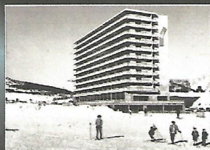
Si les premières pistes ont été inaugurées en 1966, le Bois d'Arrouze est sorti de terre au Superdévoluy au début des années 1970.